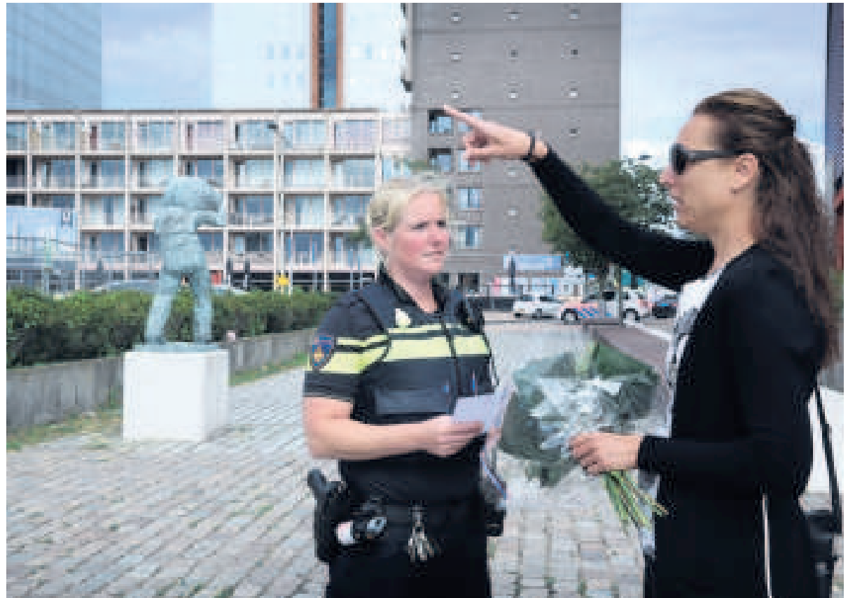
▲ Een agente vraagt een vrouw op de Wilhelminapier of zij informatie heeft over de dode baby die daar donderdag is gevonden.

Bij baby's is het moeilijk om aan te tonen waaraan ze zijn overleden, zegt Van de Goot. „Bij 50 procent