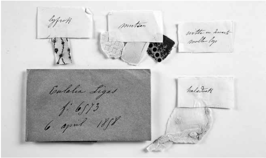
In het archief van ocmw-Gent bevinden zich van meerdere vondelingen restanten van de kleding waarin ze waren gewikkeld.

toenen lyfrok, eenen witten katoenen halsdoek, een witte lijnwaete muts gegarniert met een kantje; gebunselt in een geele katoene sargie”. ’s Anderendaags kreeg het kind in en van de Burgerlijke Godshuizen al een nieuwe bunsel, enkele dagen later gevolgd door een standaardpakketje kleding. (15)