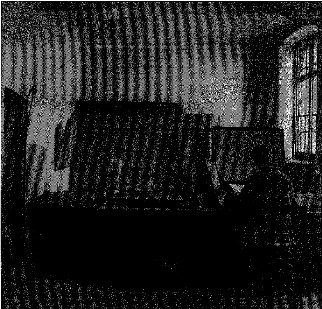
De Berg van Barmhartigheid, schilderij van Albert Caullet (Stedelijke Musea Kortrijk)

sluiting van de Berg, met op de achtergrond twee trommels. Daarop is duidelijk te zien hoe de ontvanger zijn "klanten" in het bureau zelf ontvangt. Het is uiteraard niet zeker of dit ook zo gebeurde in vroegere tijden.