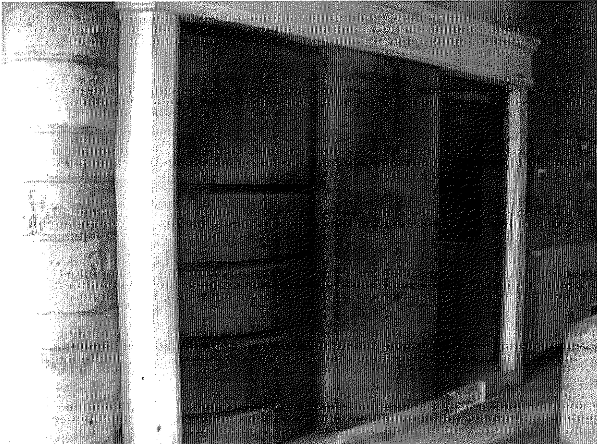
De draaitrommels van de vroegere Berg van Barmhartigheid in het Rijksarchief Kortrijk

Recent kreeg het Rijksarchief Kortrijk een grondige opfrisbeurt. Het Rijksarchief is ondergebracht in de vroegere Berg van Barmhartigheid. Deze instelling werd in 1627 door Wenzel Cobergher in Kortrijk opgericht. In de Berg kon men tegen een lage rente een lening aangaan, in ruil voor een pand. Het gebouw werd in 1630 ingehuldigd. In 1921 werd de Berg van Barmhartigheid gesloten 1 . Het Kortrijkse stadsbestuur kocht het gebouw in 1934. Enkele jaren later werden het stadsarchief en de stadsbibliotheek erin ondergebracht. Sedert 1964 is het Rijksarchief er gehuisvest 2 .