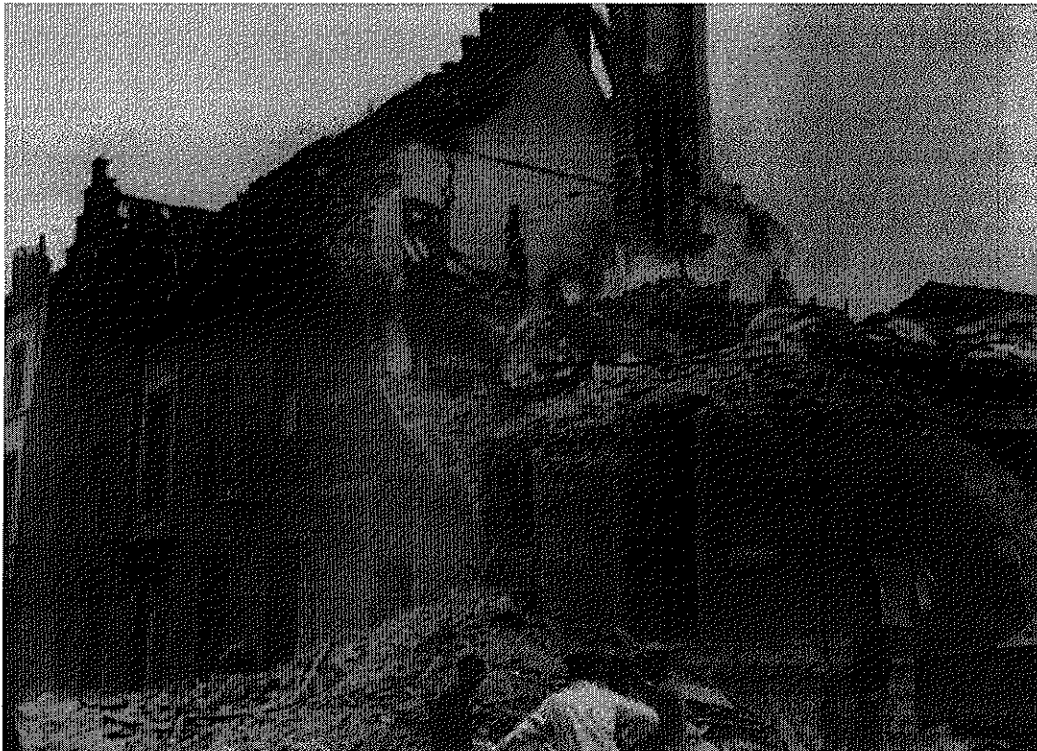
De Berg van Barmhartigheid na het bombardement van 21 juli 1944