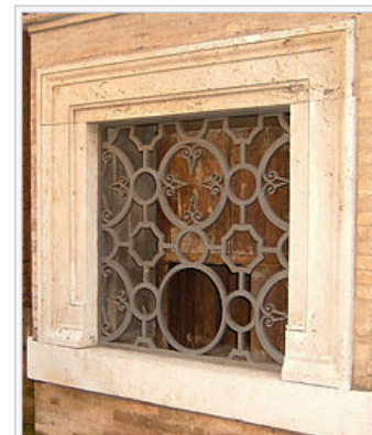
Vondelingenluikje bij de Ospedale Santo Spirito in Rome